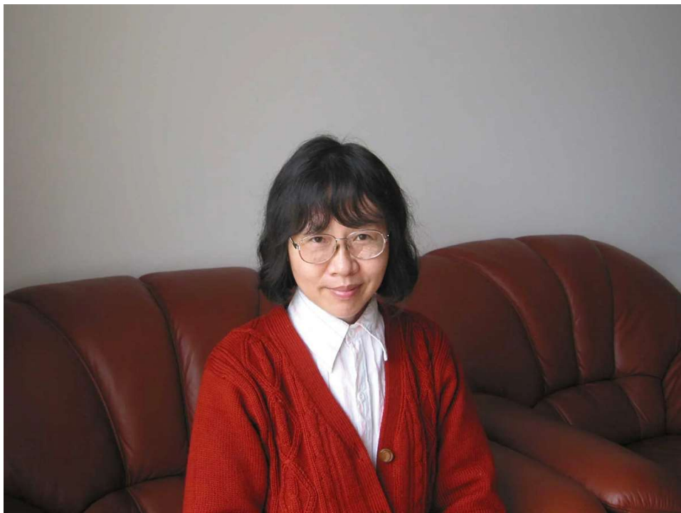
La escritora Can Xue (Changsha, China, 1953).

No sabemos si ayudará a Can Xue (seudónimo de la escritora Deng Xiaohua) el hecho de estar reiteradamente entre los candidatos al Nobel de Literatura en los últimos años. Puede ser positivo que lo sea en las casas de apuestas, no en los cenáculos literarios. Suponemos que el que se juega el dinero maneja otro tipo de información que los cercanos al ámbito de comunicación de la Academia sueca, puesto que estos últimos nunca aciertan, y si no que le pregunten a Murakami , o mejor a Bob Dylan .