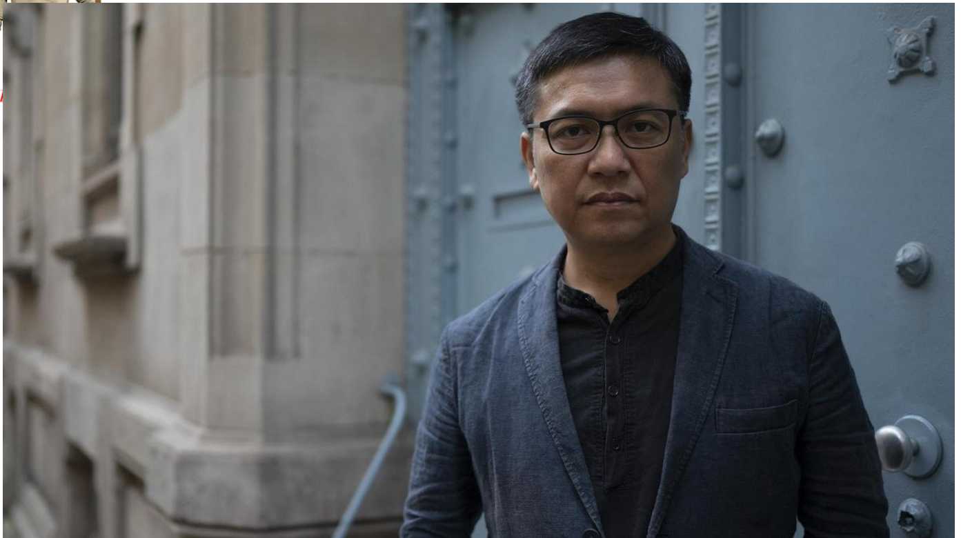
El escritor taiwanés Wu Ming-Yi, en Barcelona

El escritor taiwanés ha participado en el Festival 42, hablando de su novela 'L'home dels ulls compostos', premiada como la mejor traducción al catalán en 2023 por el PEN