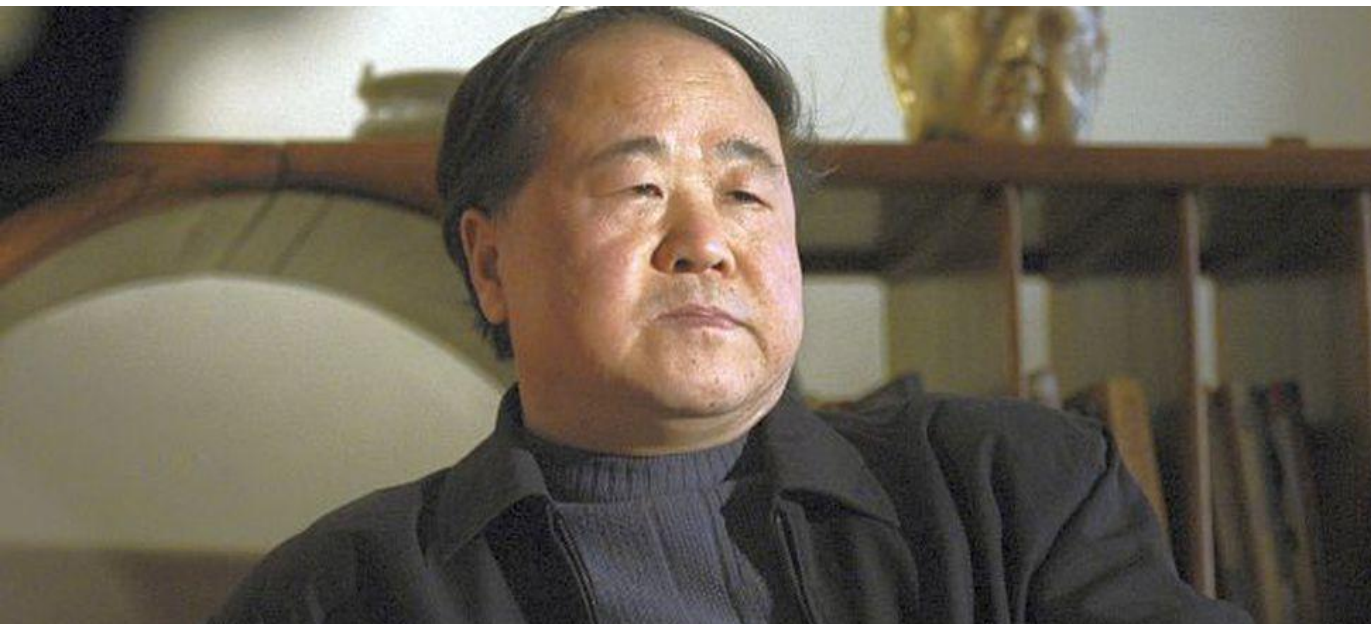
El Premio Nobel chino Mo Yan. L. O.

Francisco Millet Alcoba | 16.06.2020 | 10:50