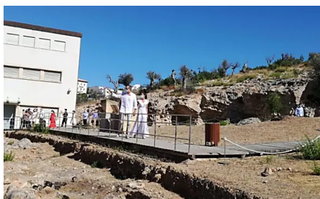
Los Reyes de España visitan Ibiza