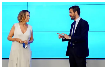
Junta Directiva del PP con los nombramientos de Cuca Gamarra, Ana Pastor y José Lui...