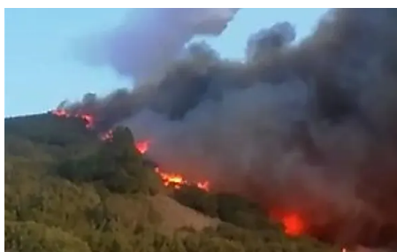
Imágenes del incendio de La Palma