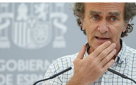
Comparecencia de Fernando Simón