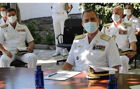
Tui recibe a Felipe VI entre vítores de "¡Guapo!" y "¡Viva el rey!"