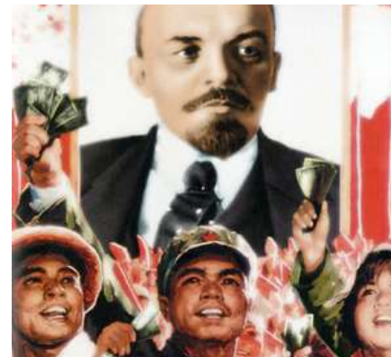
Detalle de la cubierta.

Utilizamos cookies propias y de terceros para mejorar tu experiencia de navegación y realizar tareas de análisis. Al continuar con tu navegación entendemos que las aceptas. Política de cookies Aceptar