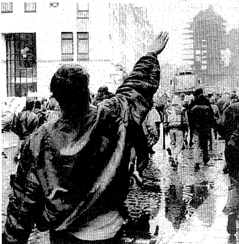
Manifestación neonazi en Dresde, en abril de 1991

Pregunta: ¿se puede extender este fascismo ex yugoslavo/serbio? Sí, responde Julliard: el mundo ex comunista (crisis económica, falta de tradición democrática, frustración social, nacionalismos exacerbados, mafias) ofrece un buen caldo de cultivo para la reaparición de la peste parda. Y Occidente, prosigue Ju-