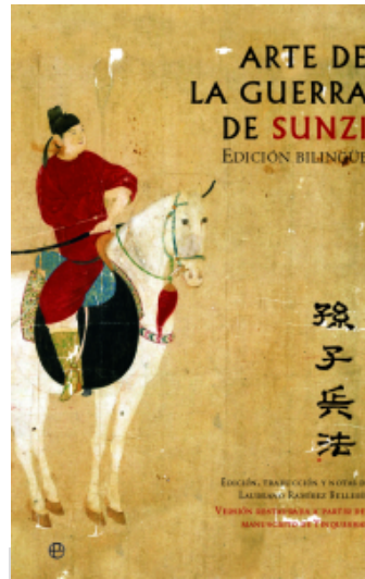
Cubierta de: Arte de la guerra