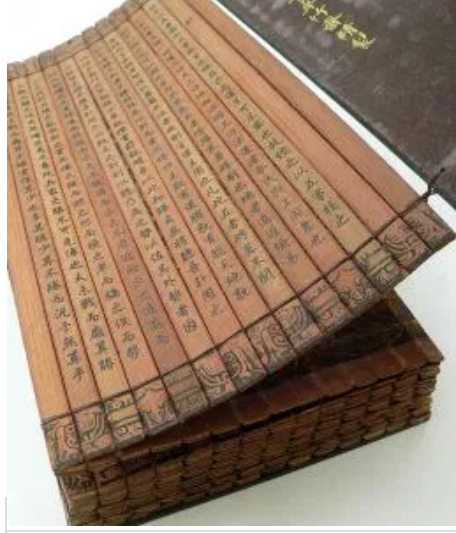
Copia de Arte de la guerra en bambú – UCR