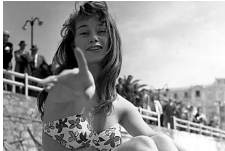
[Fotos] Hay tanta historia en estas 47 fotos que te harán... Patrocinado por Holoqente

El escritor Cristóbal Serra recupera los 'Diarios' del católico antiburgués León Bloy. Actual