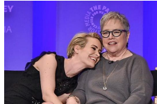
[Fotos] Parejas LGBTQ que le demostraron al mundo que... Patrocinado por Holoqente