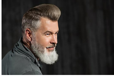
Los precios de transplante de pelo en 2020 podrían... Patrocinado por Hair Transplant