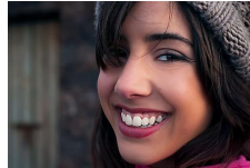
El verdadero precio de los implantes dentales Patrocinado por Implantes