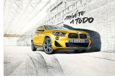
Atrévete a todo con el primer X2 de BMW. Patrocinado por BMW