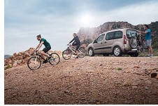
Plan C. Pide tu oferta. Citroën Berlingo desde 16.790€ Patrocinado por Citroën