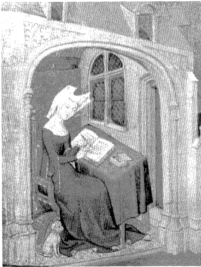
Christine de Pizan, la primera escritora profesional en lengua francesa

"La ciutat de les dames", publicada en 1405, es una obra de ficción en la que se crea un espacio físico y simbólico exclusivamente destina-